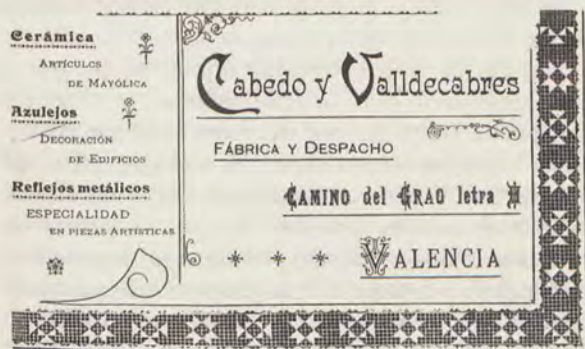
Publicidad Almanaque Las Provincias. 1903

formación artística de obreros para aplicarlo a la industria, crear colecciones públicas, museos y escuelas de artes industriales. Y esto mismo es lo que va a llevarse a cabo en Valencia, según veremos más adelante. Atendiendo a las sugerencias que había hecho Rigalt en su famoso libro, se dotaron las obras artístico-industriales que se producían con dos notas importantes: belleza y utilidad al mismo tiempo. Sin embargo, en Valencia ha de transcurrir un cuarto de siglo más para que el Ministerio de Instrucción Pública propusiera la creación de una escuela de artes y oficios artísticos y sea solicitada al mismo por la Real Academia de San Carlos para tutelarla y unirla a su Escuela Superior de enseñanza de las Bellas Artes tradicional.