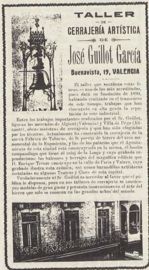
Anuncio publicitario. Valencia y su Región. Guía Exposición Regional Valenciana de 1909.

En este último caso, el tiempo mínimo será el de tres meses. Pasado este plazo podrán ser retirados los objetos expuestos. Transcurrido un año sin verificarlo, quedarán de la propiedad del Museo.