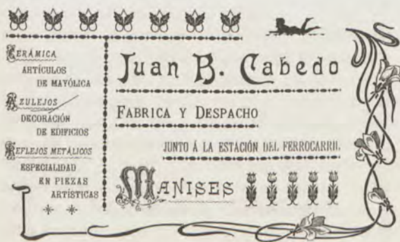
Publicidad en el Almanaque Las Provincias. 1904